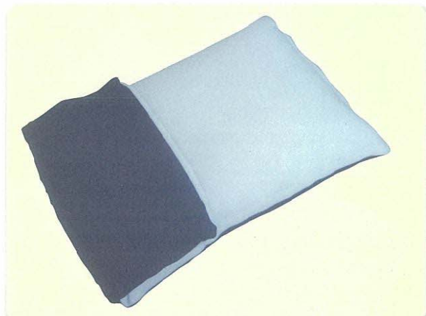
枕袋の端を多めに折りたたんで高めに調整