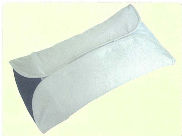
専用枕カバーをきつめに巻いて硬めに調整