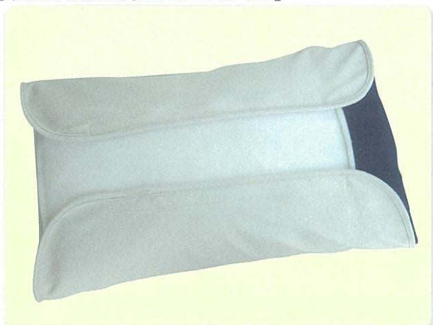
専用枕カバーを緩めに巻いて柔らかめに調整